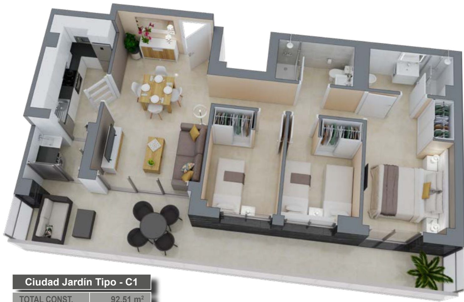
Ciudad Jardín Tipo - C1