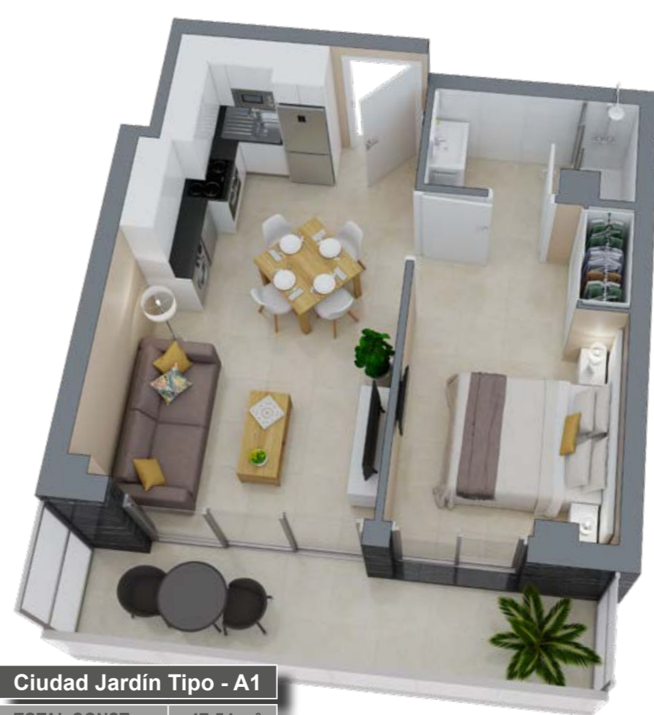
Ciudad Jardín Tipo - A1