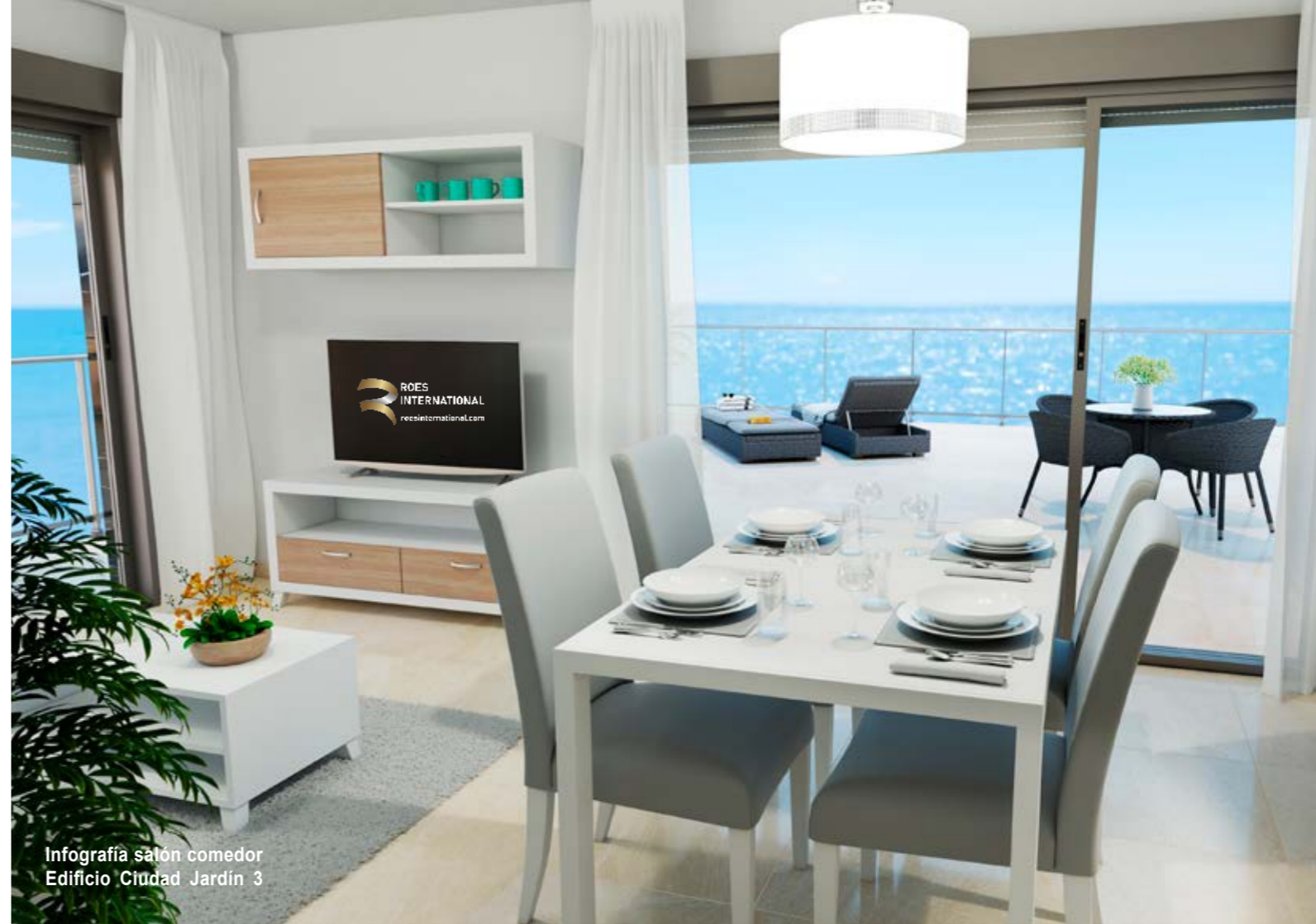
Infografía salón comedor Edificio Ciudad Jardín 3