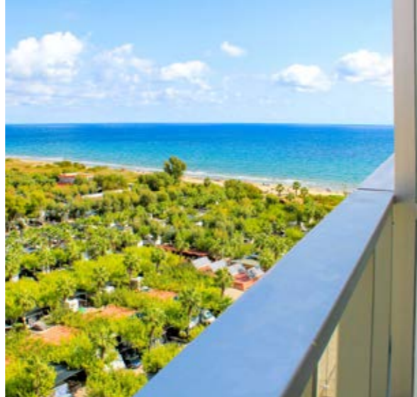
Fotografías tomadas en el Edificio Ciudad Jardín I, junto al Edificio Ciudad Jardín 3