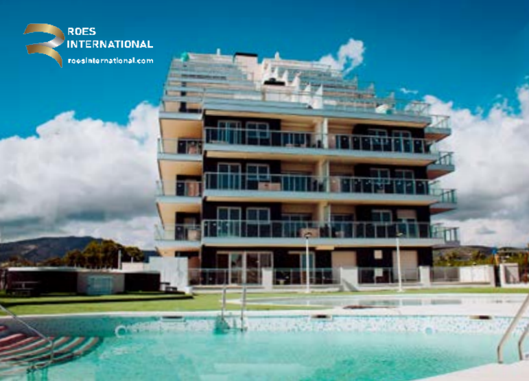
Fotografías de los exteriores del Edificio Ciudad Jardín I, junto al nuevo Edificio Ciudad Jardín 3